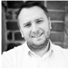
Lorant Buttinger , Jahrgang 1980, Fotograf.

Aufgewachsen in Hollabrunn, wohnhaft in Mittergrabern. Fotografieren ist meine Leidenschaft, die ich durch Zufall bei mir entdeckt habe. Heute, nach vielen Lehrgängen und Praxis-Erfahrungen, arbeite ich mit High-End Kameras sowie Studioequipment im eigenen Studio